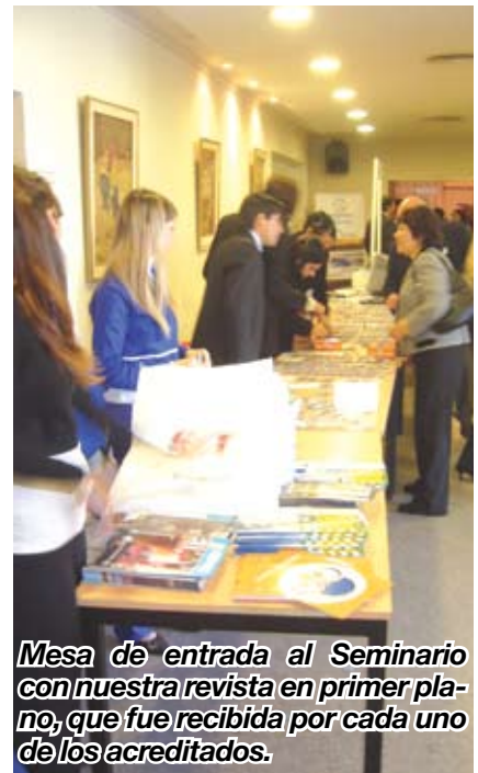
Mesa de entrada al Seminario con nuestra revista en primer plano, que fue recibida por cada uno de los acreditados.

El cierre también estuvo a cargo del presidente de la Cámara organizadora – en forma conjunta con la Asociación de Graduados de la UNLU-CRC y las Municipalidades de Zárate y Campana – ante la ausencia del Gobernador de la Provincia Daniel Scioli.