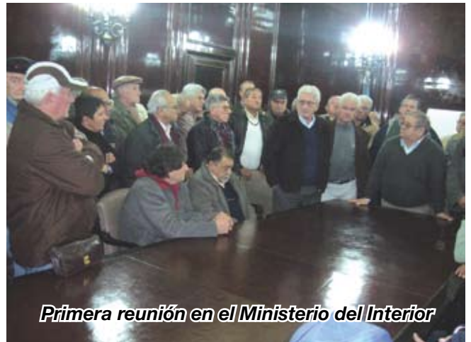
Primera reunión en el Ministerio del Interior