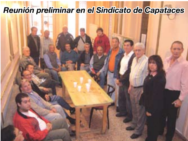
Reunión preliminar en el Sindicato de Capataces