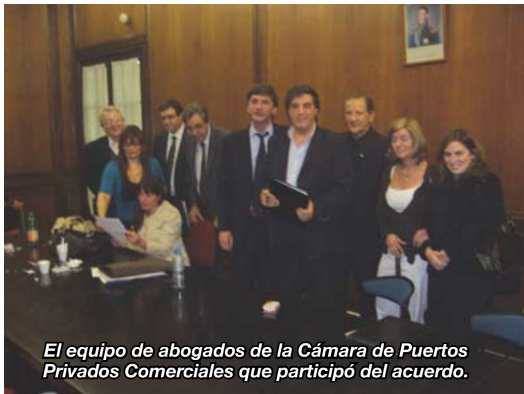
El equipo de abogados de la Cámara de Puertos Privados Comerciales que participó del acuerdo.

Con lo que se cerró el acto, labrándose la presente que leída es firmada de conformidad y para constancia, ante el actuante que certifica, siendo las 12 horas.