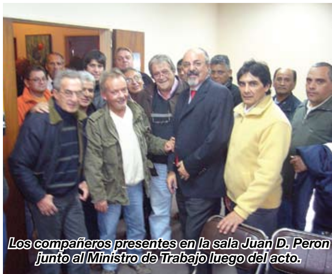
Los compañeros presentes en la sala Juan D. Perón junto al Ministro de Trabajo luego del acto.

Para eso, nada más – pero también nada menos –que para eso, desde el Ministerio de Trabajo hemos lanzado esta idea de los cursos de formación y capacitación. Para que sea una excusa para que se encuentren y sientan renacer el vínculo solidario. Aquel espíritu solidario fundacional del sindicalismo y que en esta actividad, en este sector, es tan importante. Porque