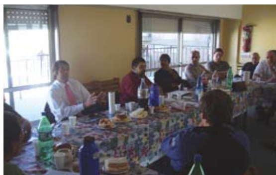
Las fotos muestran las reuniones previas en Guincheros, Capataces y Apuntadores