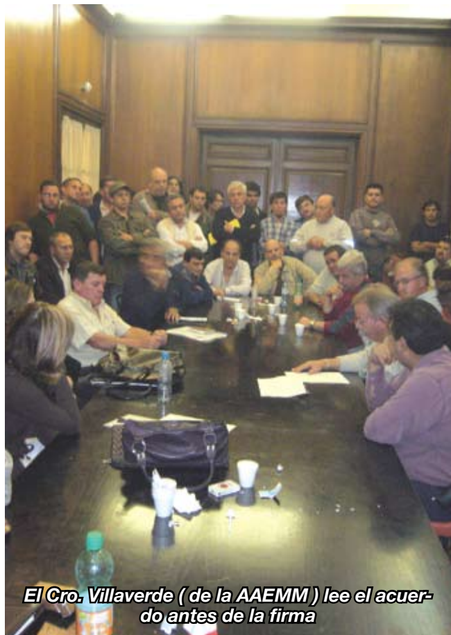
El Cro. Villaverde ( de la AAEMM ) lee el acuerdo antes de la firma

Las partes ratifican que la pauta salarial es negociada y convenionada únicamente por las partes signatarias del CCT 431/05.